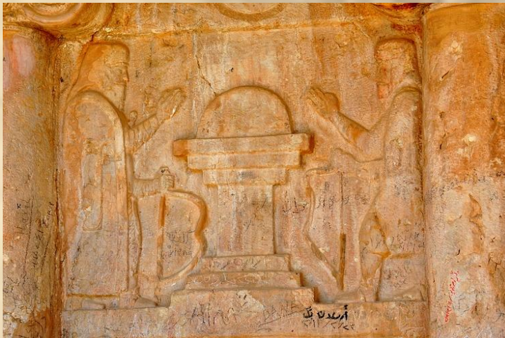
Ανάγλυφο από τάφο λαξευμένο στο σημερινό Ιράκ, στην περιοχή του Κουρδιστάν. Απεικονίζονται δύο ανδρικές γωνιές αντικριστά σε χειρονομία χαιρετισμού και ανάμεσά τους ένας βωμός. Πάνω στον βωμό καίει η ιερή φωτιά. Ο ζωροαστρισμός έχει έντονα στοιχεία πυρολατρείας. Αχαιμενιδική περίοδος.